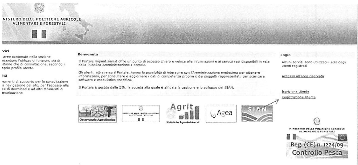
Fig. 2 – Registrazione – Link alla registrazione